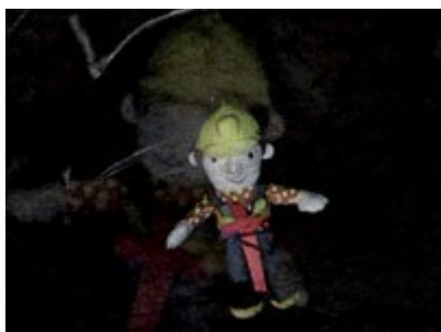
Or not toupie

Les sites Internet des installations sont des lieux d'expression personnelle, notamment sur l'art. Avec « De l'art si je veux », des enfants du quartier des Sablons au Mans s'approprient les œuvres de Bacon, Basquiat, Duchamp ou des frères Chapman. La démarche de Nicolas Clauss n'est donc pas uniquement numérique. C'est là le pari sous-jacent de chaque rencontre : intéresser à l'art des jeunes que rien ne prédispose à approfondir le sujet.